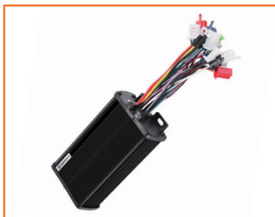
Bộ điều tốc thông minh