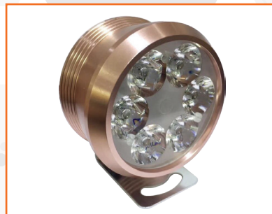
Đèn led siêu sáng