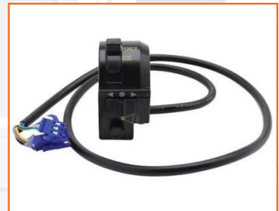
Cụm công tắc m133