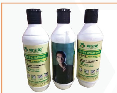
Keo tự vá - Chống ăn vành