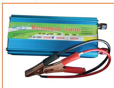
Bộ kích điện