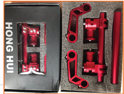
Tay lái độ đủ màu hàng MOXY cao cấp