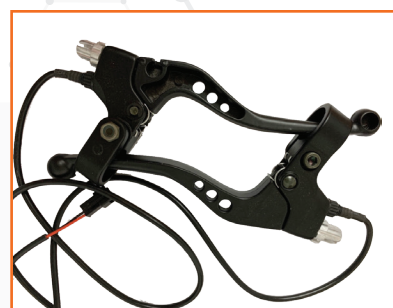
Tay phanh xe điện