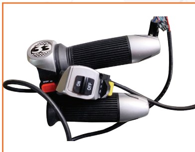
Bộ tay ga cao cấp