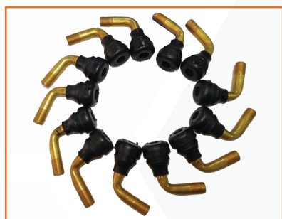
Van xe điện