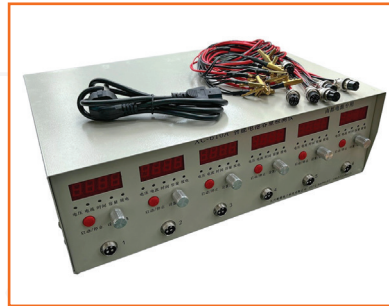
Máy xả điện cho ắc quy XC-601A