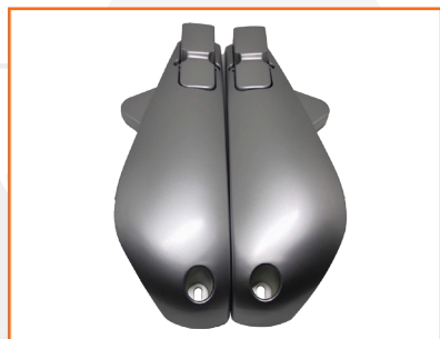
Ốp càng xe máy điện