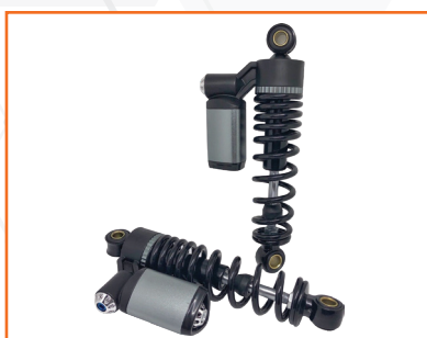
Giảm sóc sau xe điện