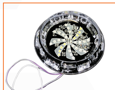
Đèn LED trang trí