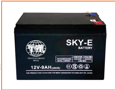
Ắc quy cửa cuốn, bình thuốc sâu 12v-9Ah