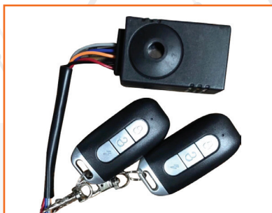
Bộ chống trộm thông minh