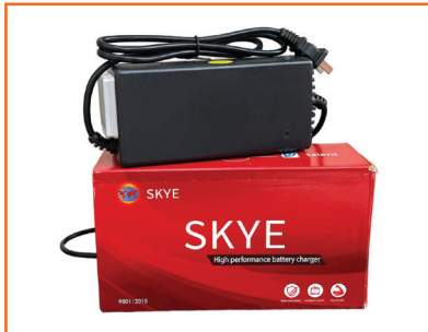
Bộ sạc SKYE cao cấp