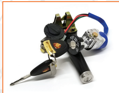
Bộ khoá xe điện m133s