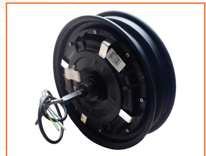
Động cơ xe máy điện