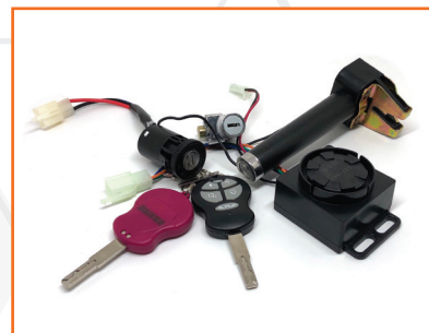
Bộ khoá xe điện m133